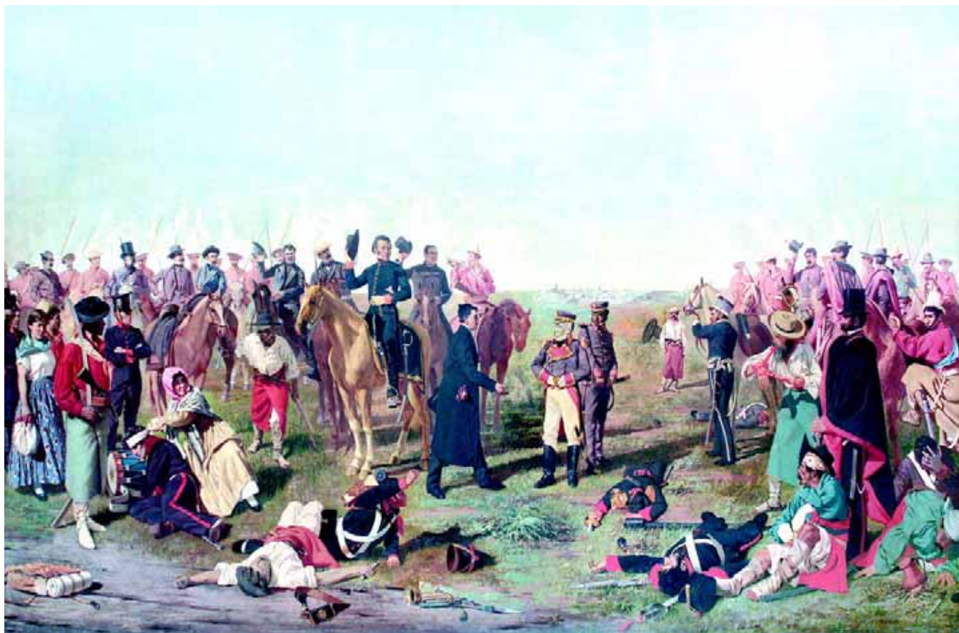
La Batalla de Las Piedras. Juan Luis y Juan Manuel Blanes. Oleo s/tela. Museo Histórico Nacional.