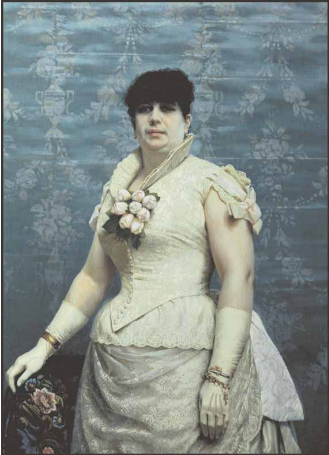
Retrato de Carlota Ferreira. Óleo s/tela -1886 - Museo Nacional de Artes Visuales.