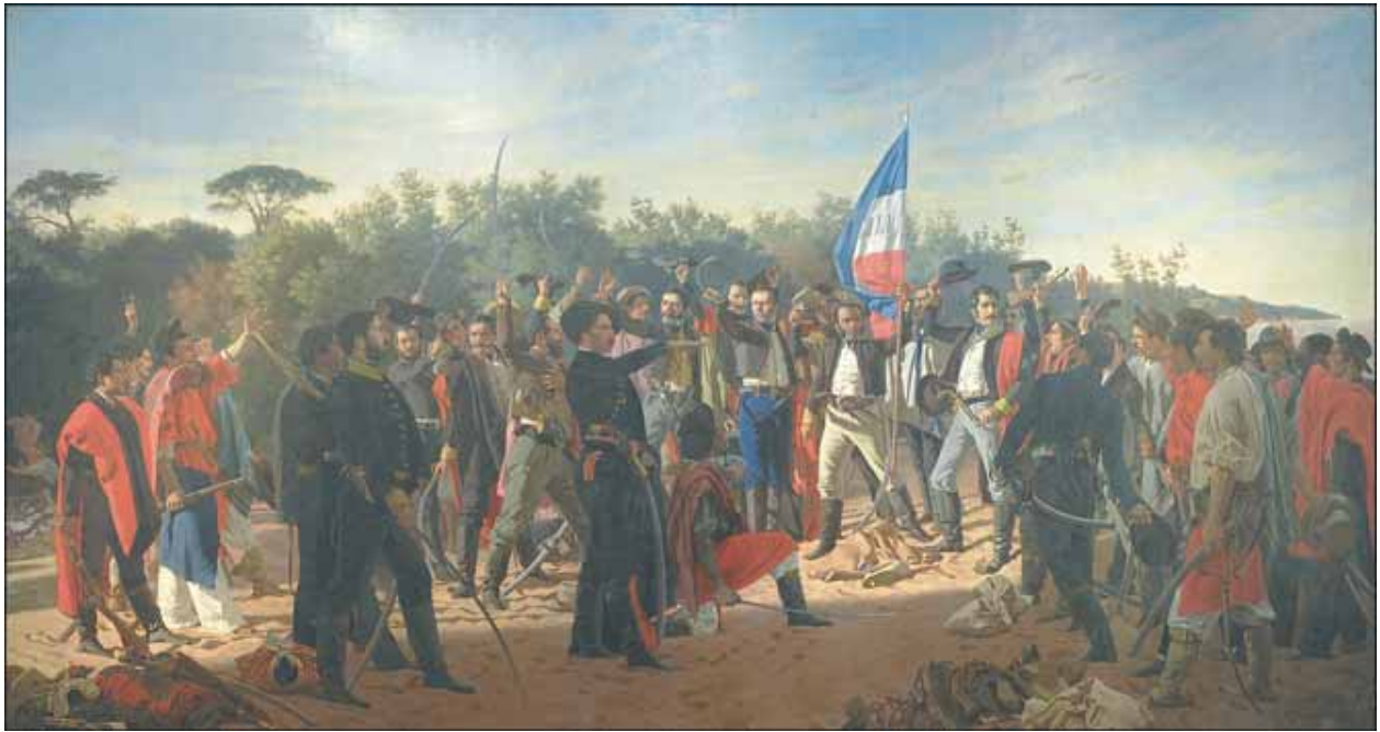
Juramento de los Treinta y Tres Orientales. Óleo s/tela. 1875-1878. Museo Nacional de Artes Visuales