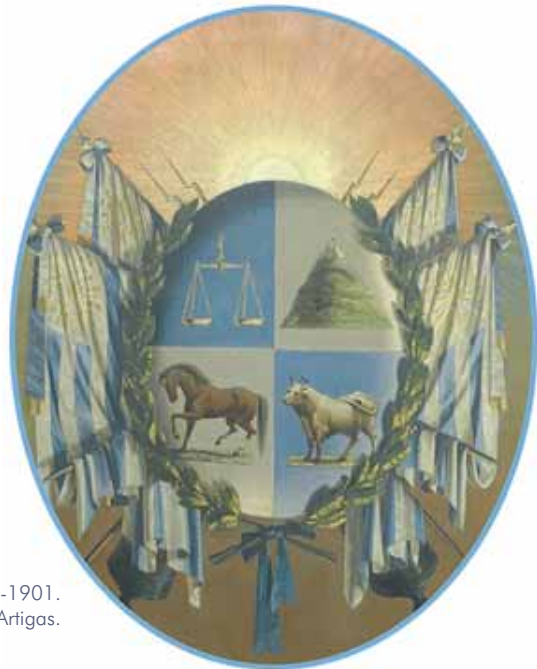
Escudo Nacional. Óleo s/tela. 1830-1901. Museo de la Casa de Gobierno, Edificio Artigas.