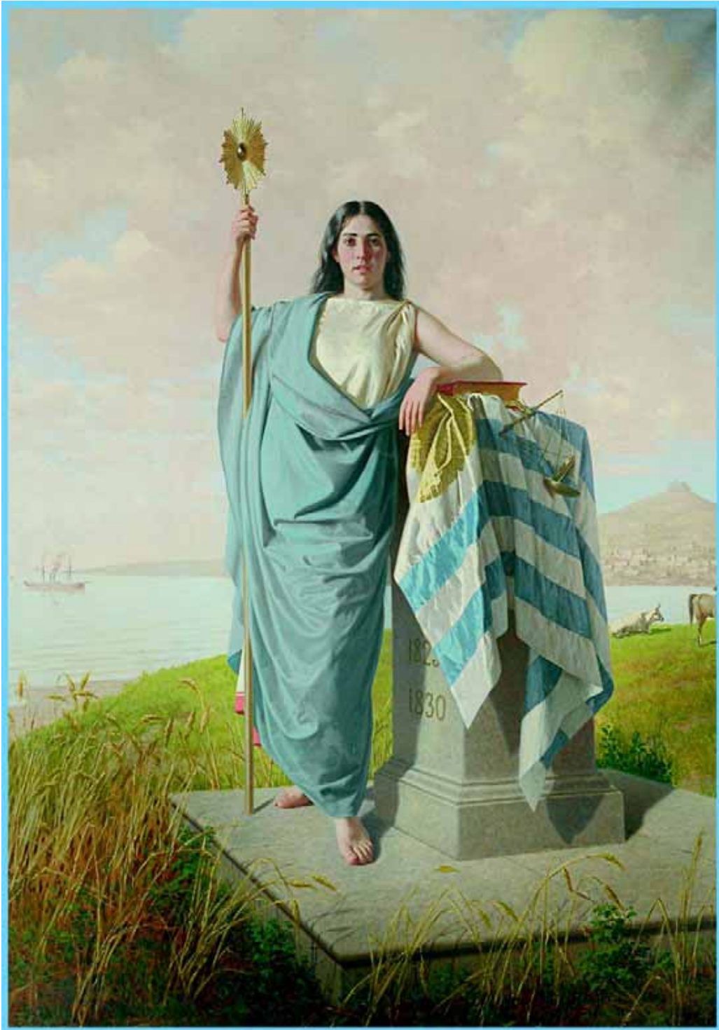
El Altar de la Patria. Oleo s/tela. Museo de la Casa de Gobierno, Edificio Artigas.