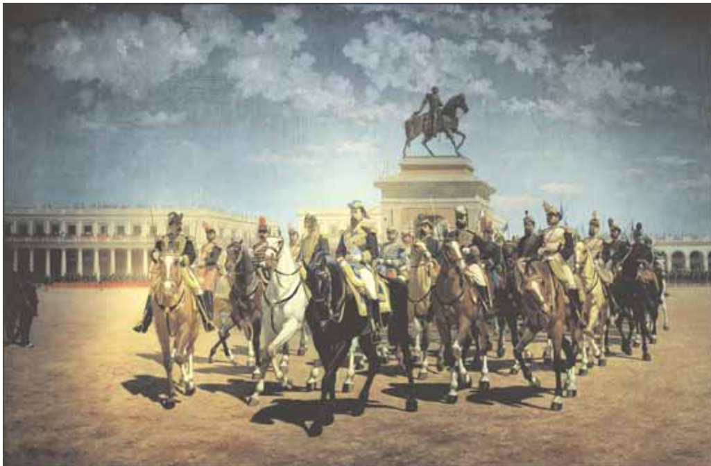
La Revista de 1885. Óleo s/tela - Museo Nacional de Artes Visuales. Primera fila, de izquierda a derecha: Gral. Angel Farías, Gral. Máximo Tajes (Ministro de Guerra); Tte. Gral. Máximo Santos (Presidente de la República), Gral. Manuel Pagola, Cnel. Manuel Benavente.