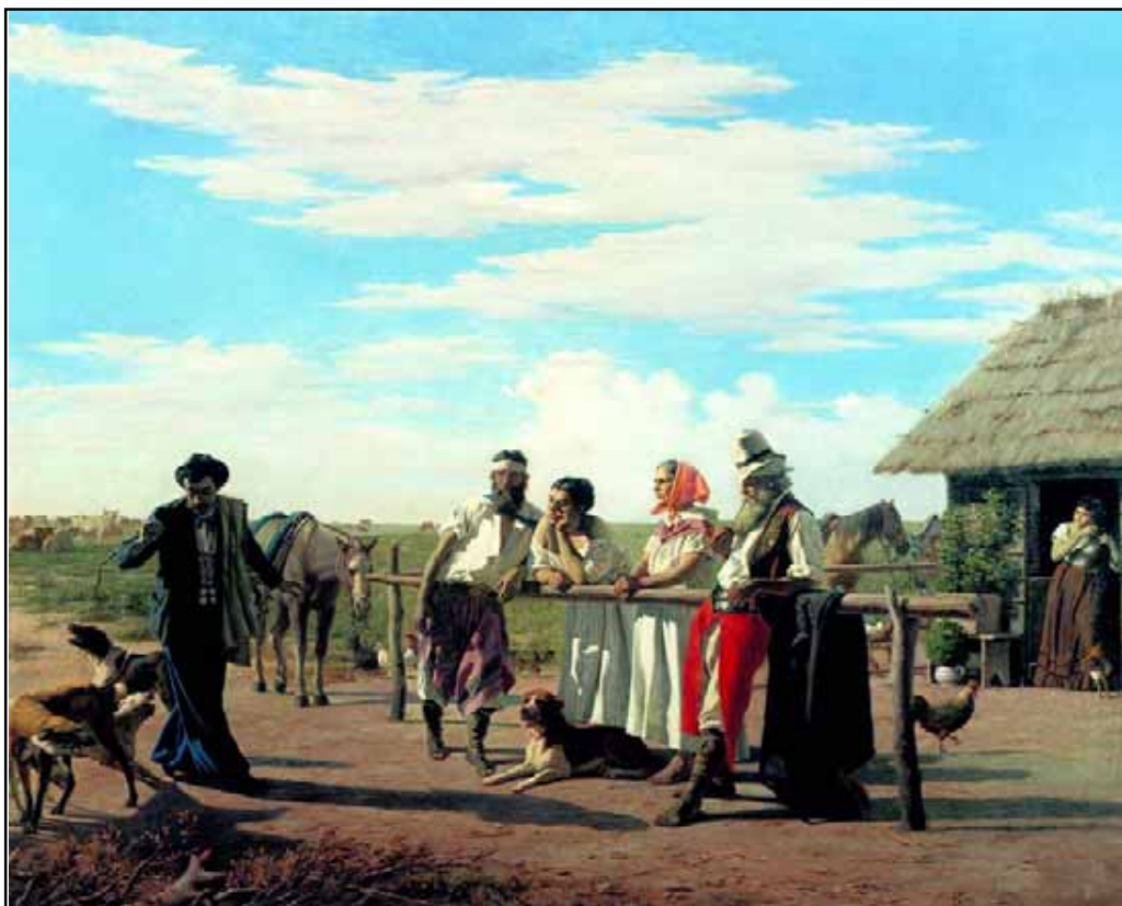
Los Tres Chiripás. 1881 - Óleo s/tela. Museo Histórico Nacional.

Batlle el RETRATO OFICIAL DEL GENERAL FLORES.