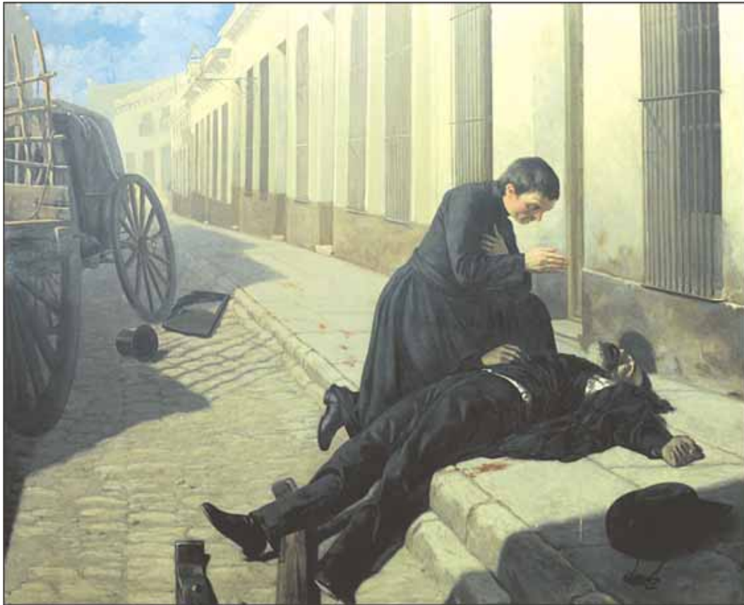
Asesinato de Gral. Venancio Flores. Óleo s/tela - Museo de la Casa de Gobierno, Edificio Artigas.