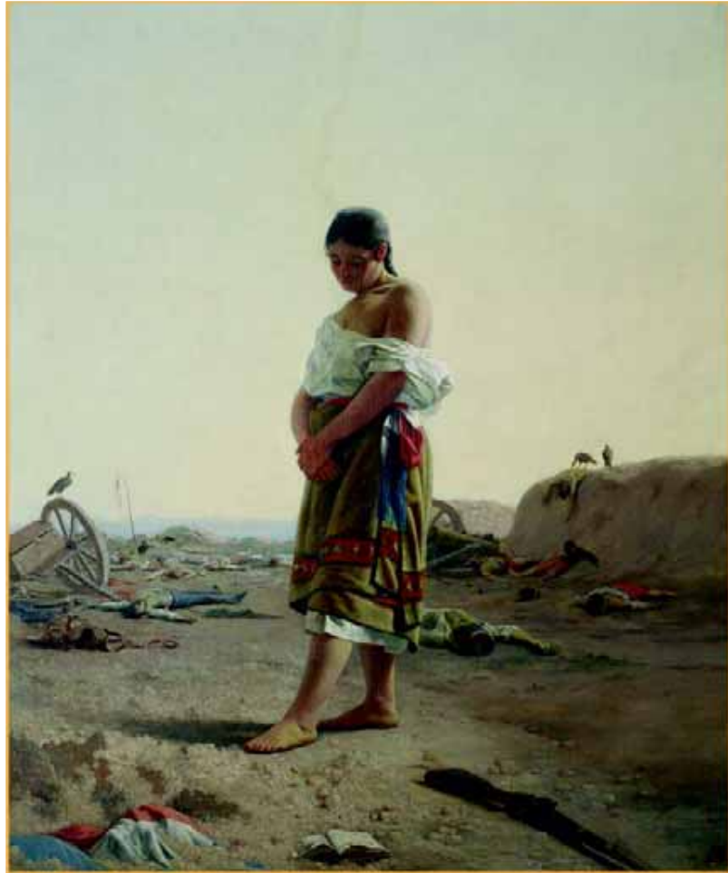
La Paraguaya. Óleo s/tela. Museo Nacional de Artes Visuales.

1882 - Viaja a Venecia donde concreta ideas para "LA BATALLA DE SARANDI".