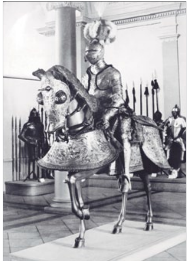
Armadura para jinete y caballo del rey de Suecia Erik XIV Europa - Siglo XVI