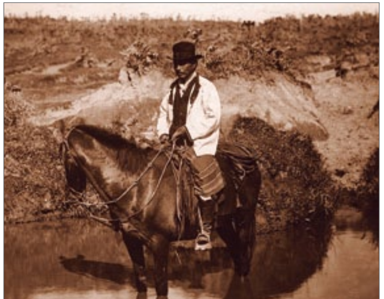
Buscando paso - ca. 1895