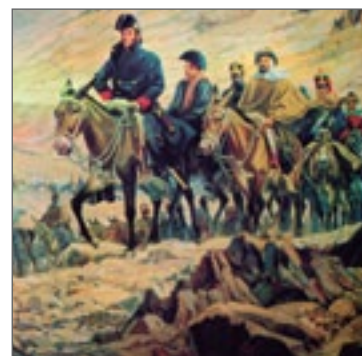
San Martín en el cruce de los Andes. Asociación Sanmartiniana de Alte. Brown