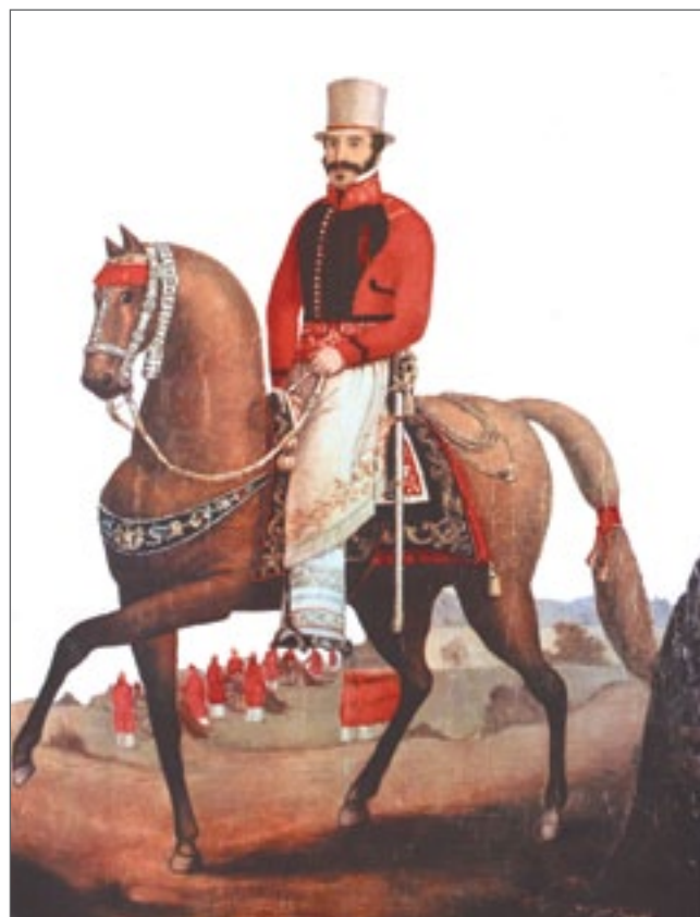
Retrato del Coronel Martín Santa Coloma Félix Revol - 1847

Estribo de plata. Ojo fundido y cincelado. Arco fundido y cincelado. Falda y pisada fundida en una sola pieza. Pisada con dos corazones calados. Buenos Aires Siglo XIX