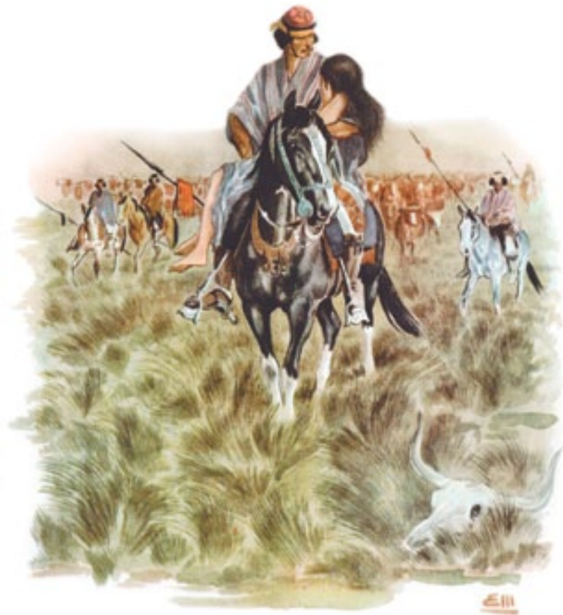
Aquel desierto se agita Eleodoro Marengo