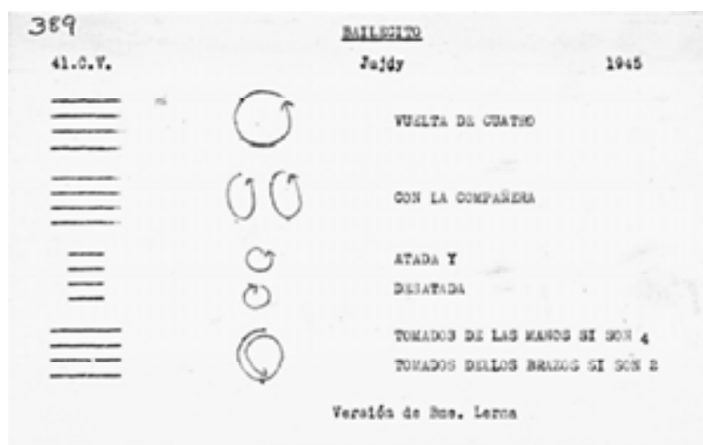
Fig. 2. Ficha 389, Bailecito. FDCV IIM. Esquema de la danza y estructura de los versos y las coplas.

Algunas fichas fueron escritas por Vega y otras por sus colaboradoras y discípulas; por esa razón se distinguen distintas caligrafías y se infiere que algunas fueron confeccionadas en el contexto del trabajo de campo y otras en gabinete 6 .