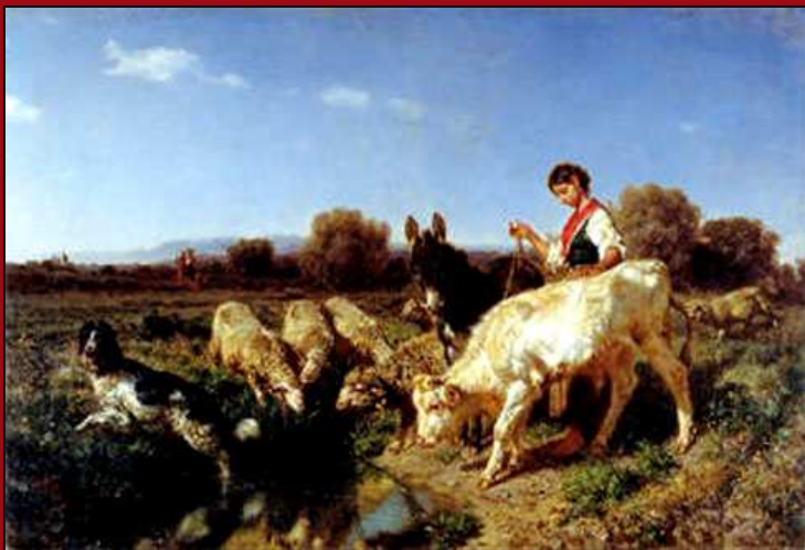
74. All'Abbeverata . Óleo. 1860. MST