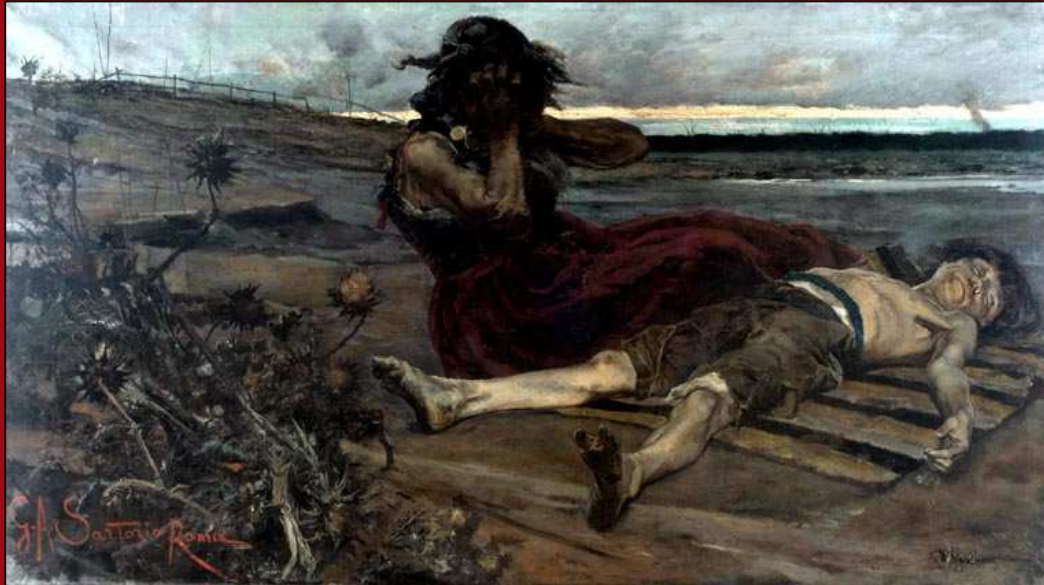
78. Malaria . Óleo. 1883. MNBA