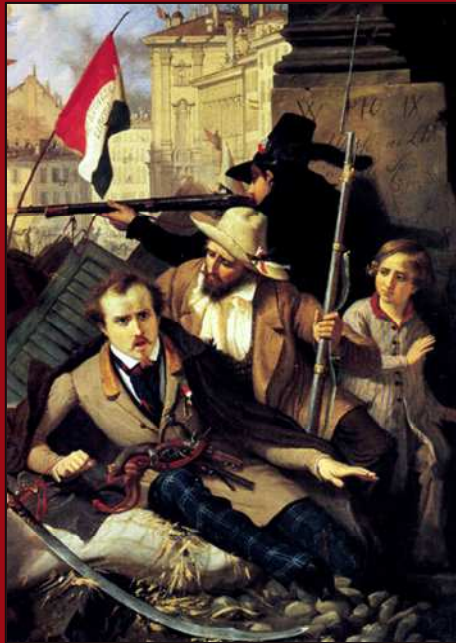
83. Episodio de las Cinco Jornadas en Milán. Óleo. MRM