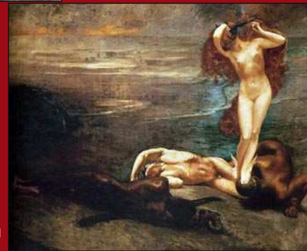
79. Gorgona y los héroes . Óleo. 1883. GNAM