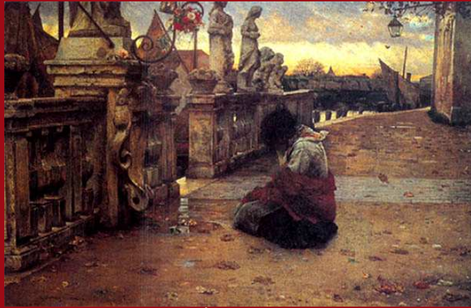
68. Refugium Peccatorum . Óleo. 1882. GNAM