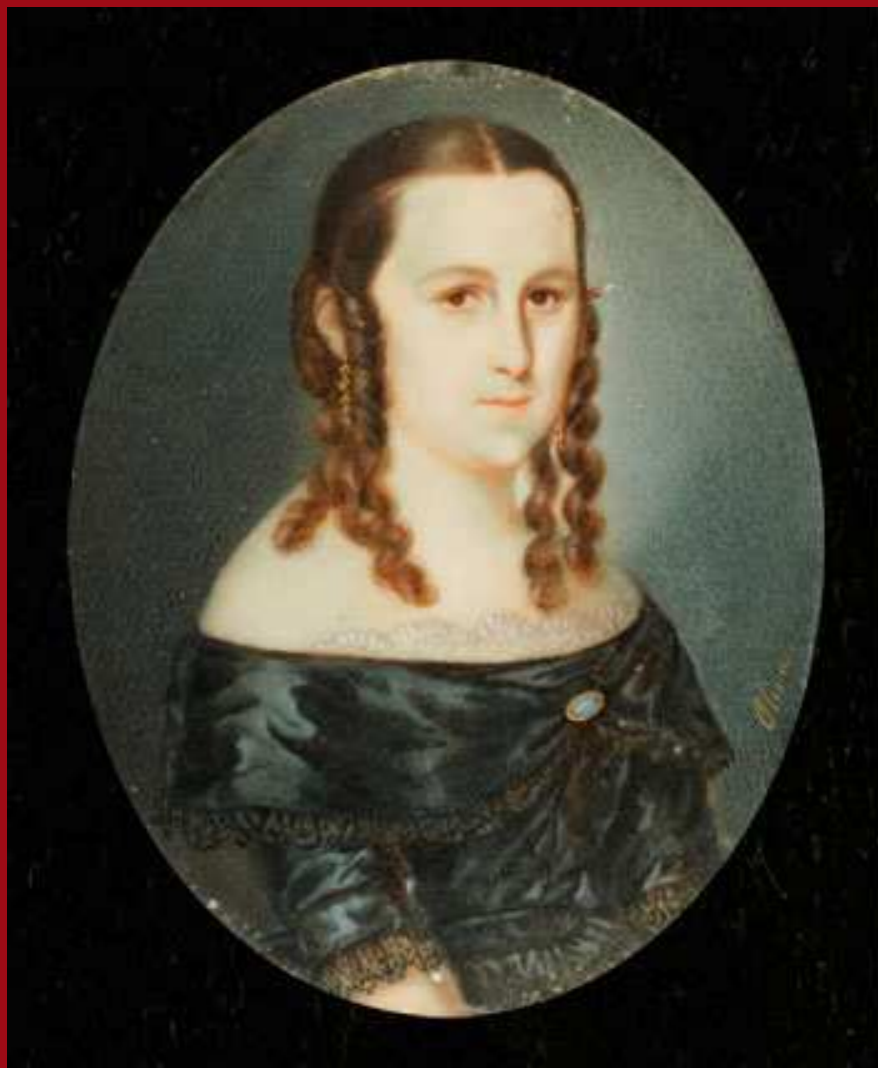
71. Retrato de señora. Miniatura. MNBA