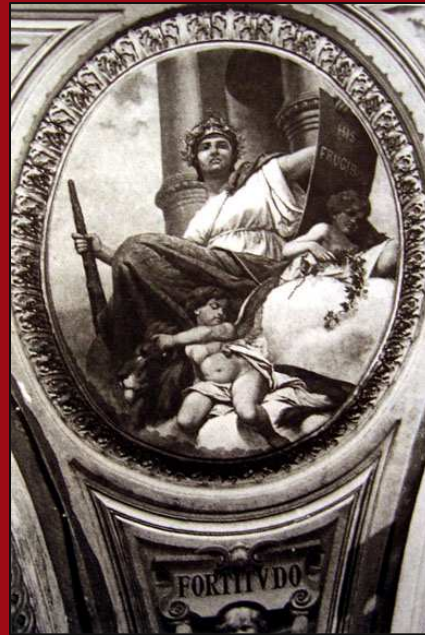
76. Virtudes cardinales: Fortaleza. Encausto. 1900. CBA