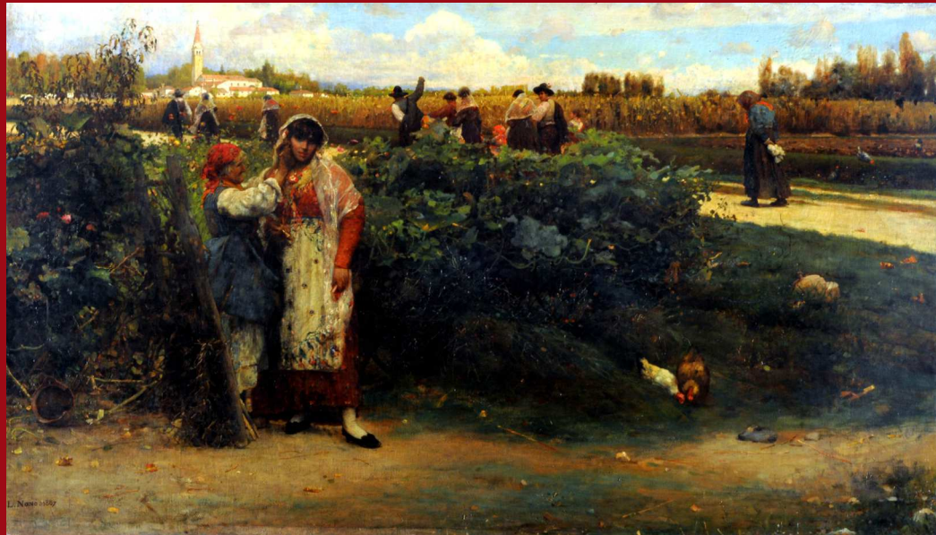
69. Los Zarcillos de fiesta . Óleo. 1887. MNBA