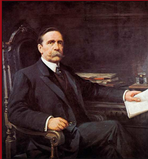
75. Carlos Pellegrini. Óleo. 1906. MHN