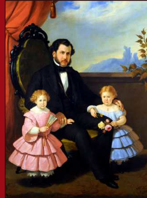
85. Retrato de caballero y niñas. Óleo. c.1858. MNBA