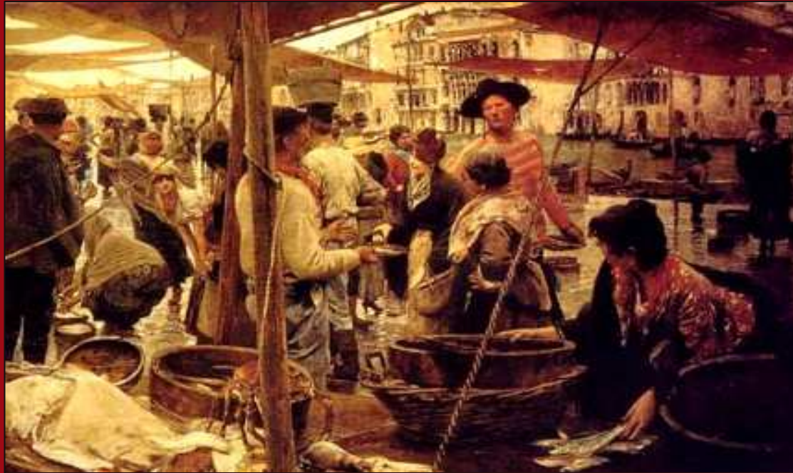
80. Pescadería Vieja . Óleo. 1893. GNAM