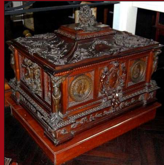
77. Cofre para la bandera de gala. Óleo. 1906. MNT