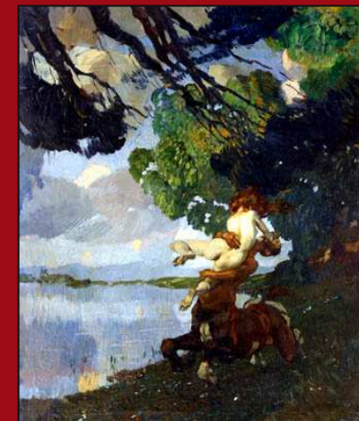
82. El rapto . Óleo. MNBA