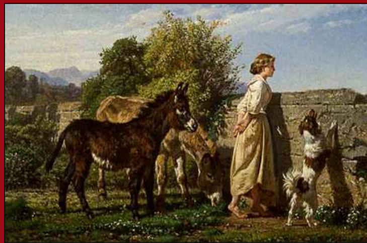
73. Firenze . Óleo. 1872. Cp