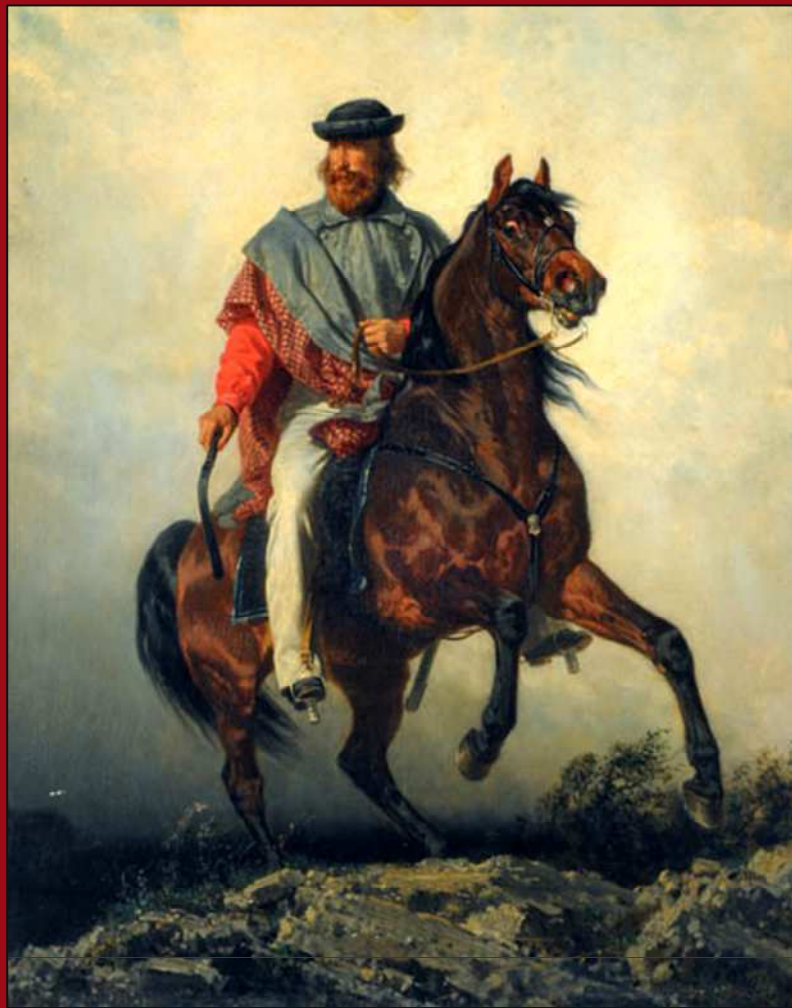
72. Garibaldi a caballo . Óleo. 1860. MNBA