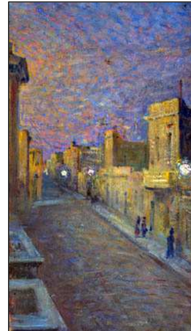
51. Calle Piedras y San Juan . Óleo. MNBA