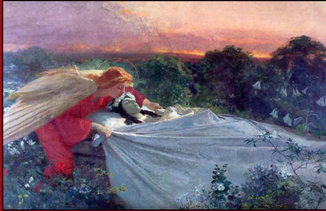
62. El ángel de la muerte . Óleo. 1897. MNBA