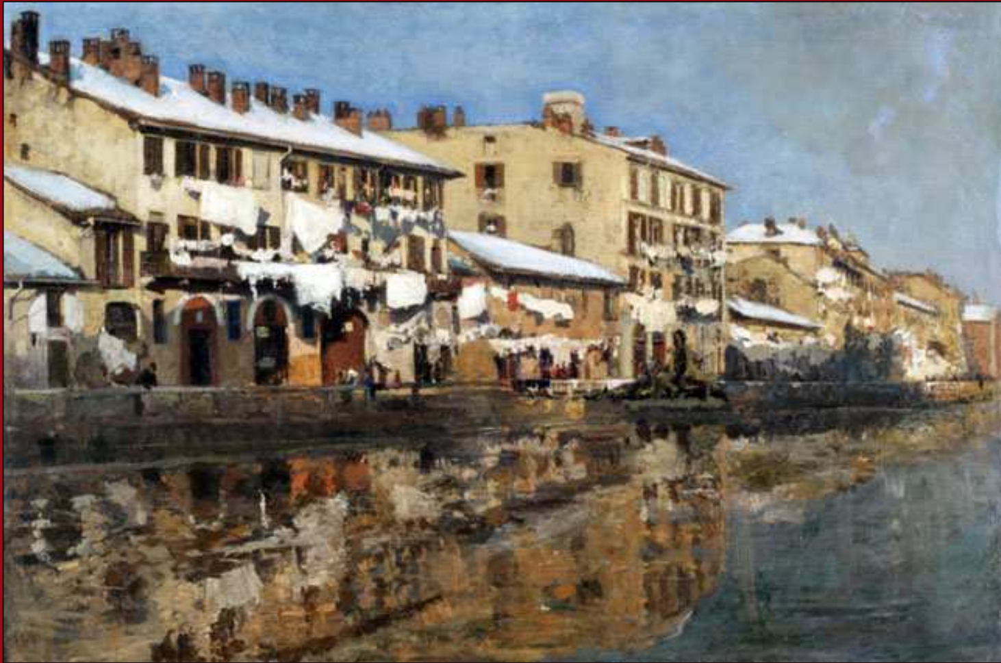
46. El Navigio de Milán . Óleo. c.1890. MNBA