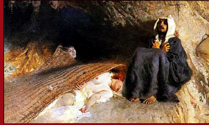
63. La tentación de San Antonio . Óleo. c.1887. GNAM