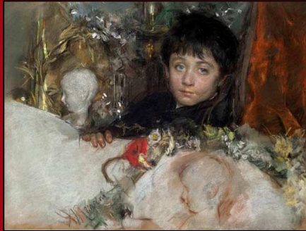
56. Retrato de un niño joven. Pastel y acuarela. c.1885. Cp