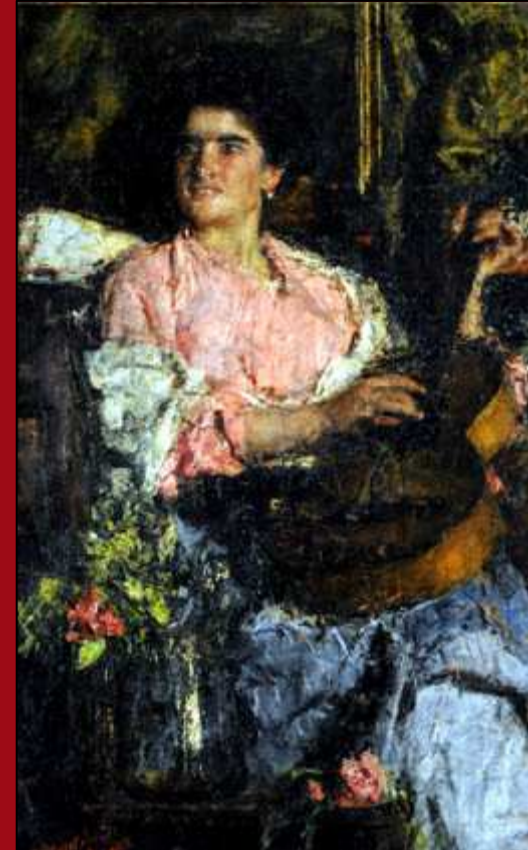
59. Canción alegre. Oleo. c.1890. MNBA