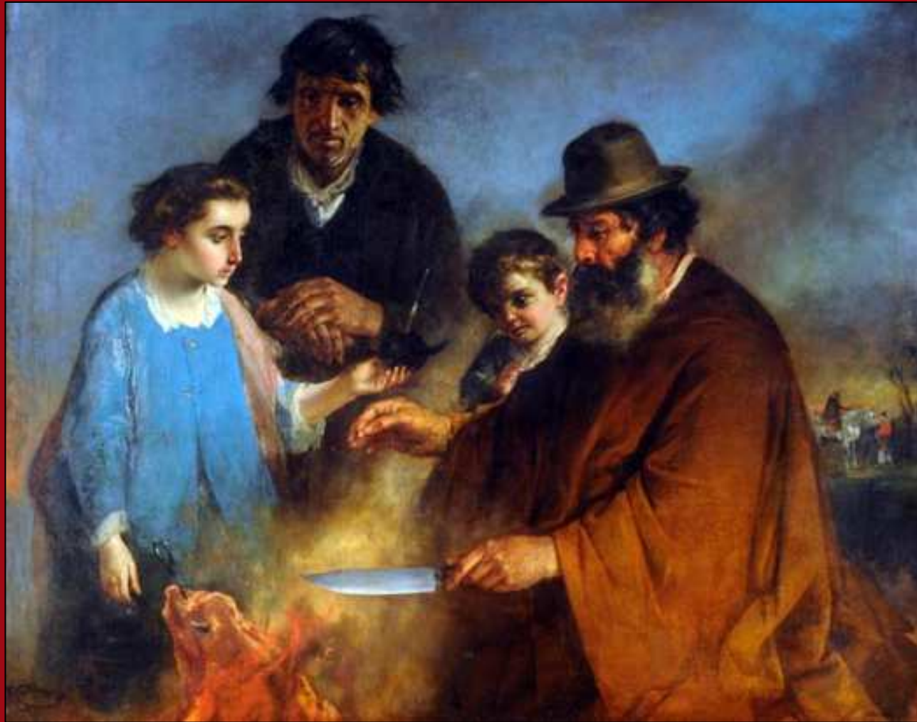
61. El asado . Óleo. c.1871. MNBA