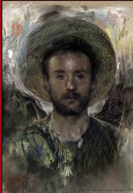
57. Autorretrato. Pastel y acuarela. 1883. Cp