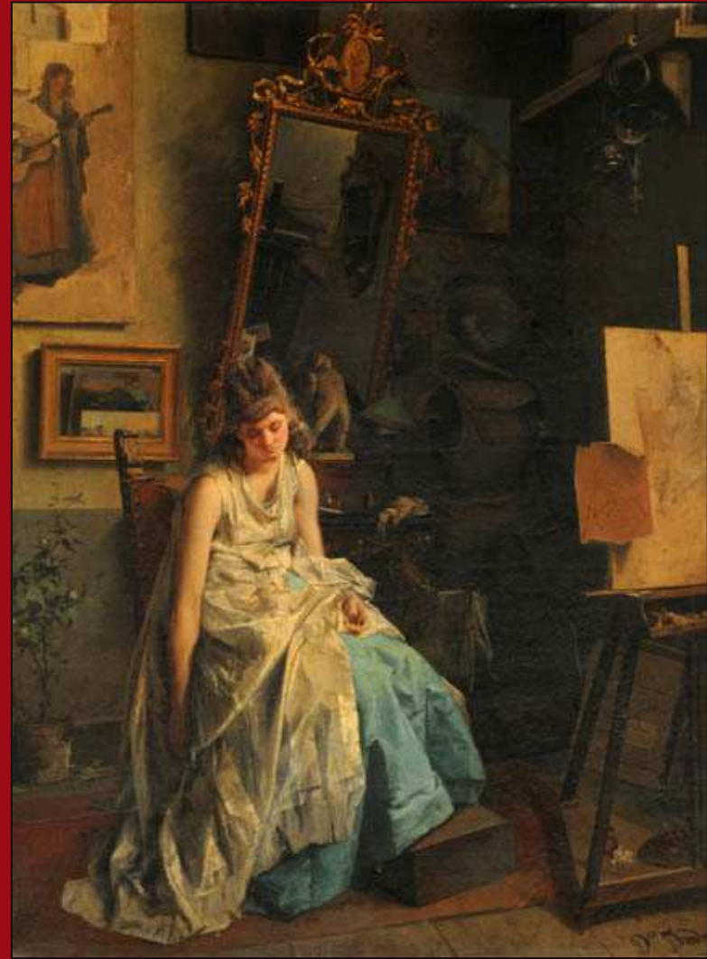
48. La modelo . Olio. c.1872. MNBA