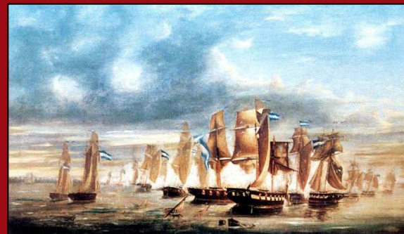
67. Combate del Juncal fase final. Óleo. 1865. INB