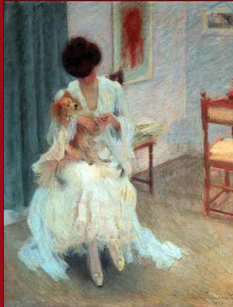
50. Patita enferma. Óleo. 1906. MNBA