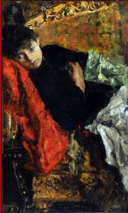
58. Pensativa. Oleo. c.1890. MNBA