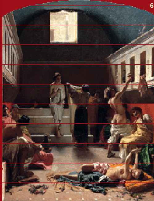
64. El baño pompeyano . Óleo. 1861. FIBB