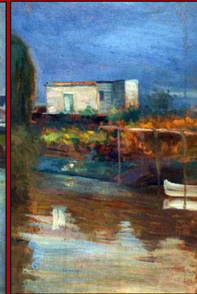
53. Ribera de la isla Maciel. Óleo. 1900. MNBA