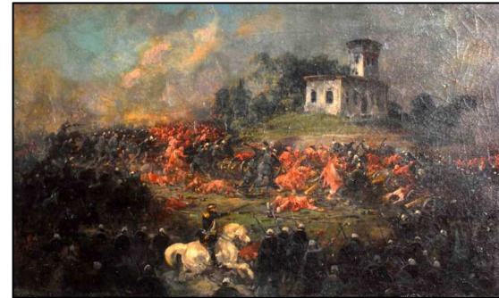
60 Batalla de Pavón . Óleo. 1861. MM