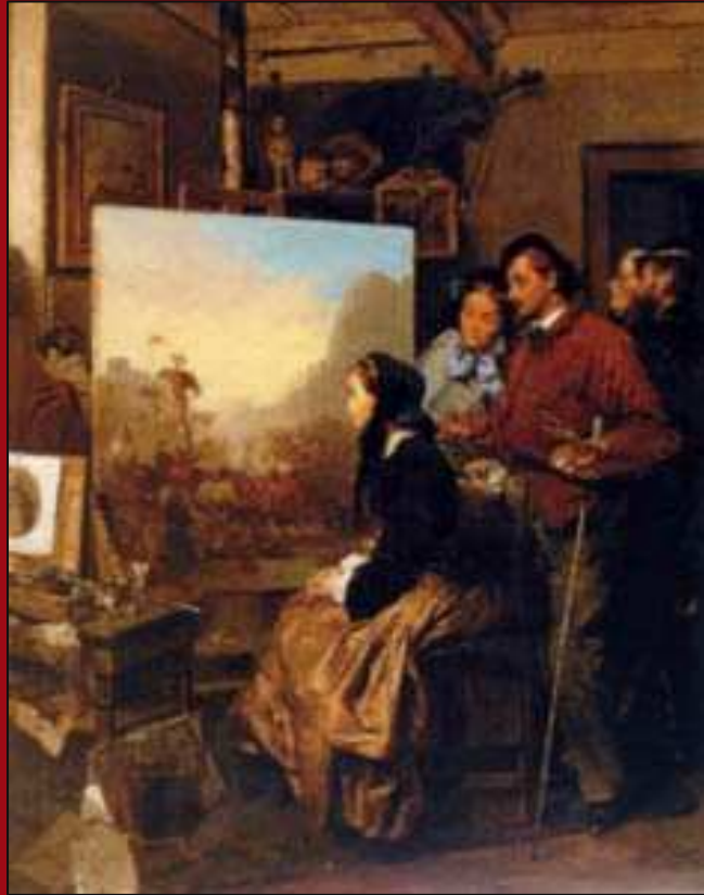
47. Un pensiero a Garibaldi . Olio. Cp